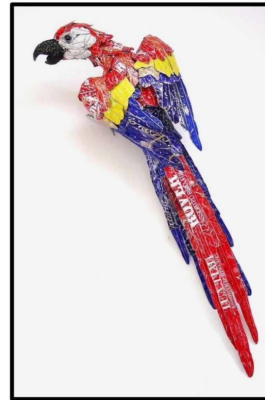
מרט אופנהיימר-תוכי מנייר