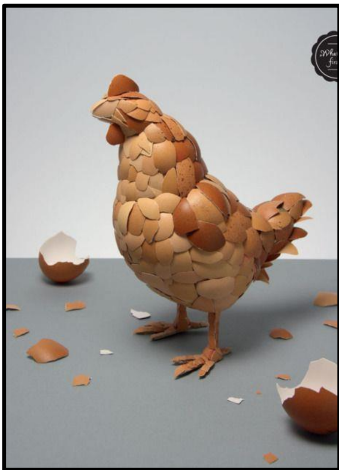
מרט אופנהיימר- תרנגול מקליפות ביצים