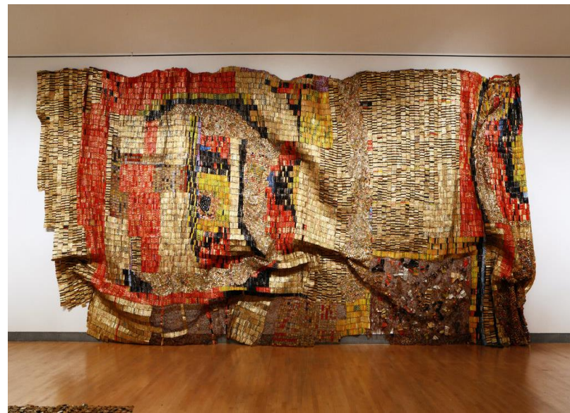
אל אנטסואי, שטיח ענק מבקבוקים ופקקים