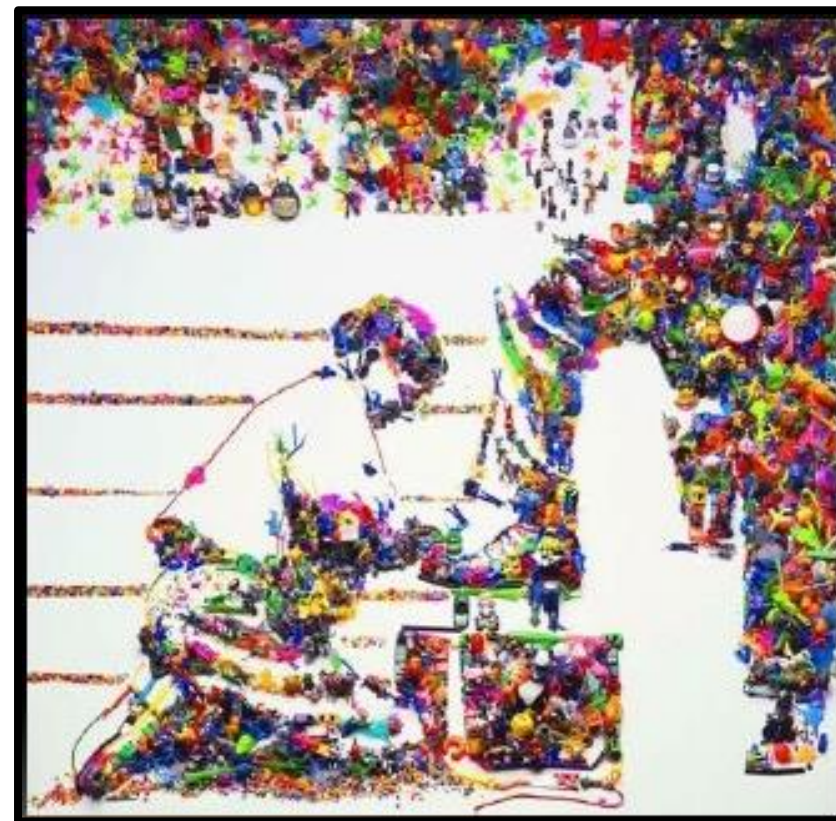
ויק מוניז-ילד מצחצח נעליים, פיסול משאריות צעצועים