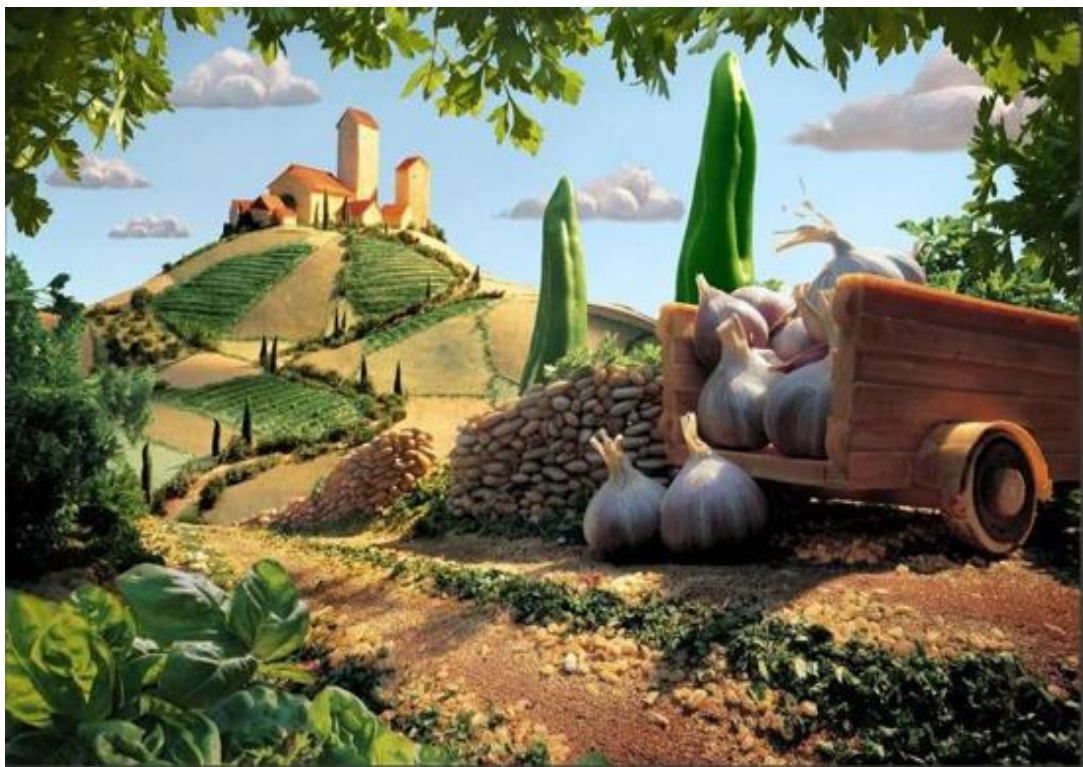
קארל וורנר מצלם נופים שסידר מירקות וקטניות