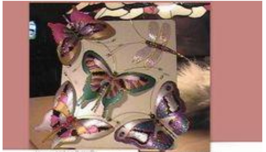
How to Make a Butterfly